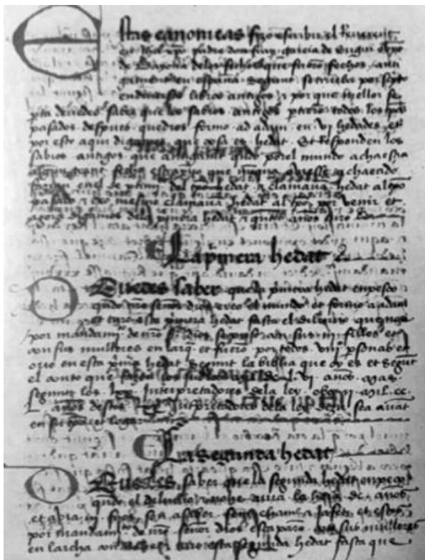
Cronica d'Espayña de García de Eugui (Biblioteca del Real Monasterio de San Lorenzo de El Escorial: X-II-22), fol. 1r

reis lleonesos per legitimar la monarquia navarresa i reivindicar el seu paper en la Reconquesta i en la "recuperació" territorial, García de Eugui es desmarca d'aquest text –que, de fet, és una de les seves fonts principals– i mostra, per la seva banda, els vincles familiars entre Roderic i Pelagi. D'altra banda, l' Estoria de los Godos , una altra de les fonts principals d'Egui, hereta el pensament polític transmès a De Rebus Hispaniae , obra de l'arquebisbe toledà Rodrigo Jiménez de Rada. L'obra del "Toledà" l'hem de situar en el context castellà de principis del segle XIII; es tracta d'un període d'hegemonia enfront dels veïns cristians i se situa al cor de tot el conjunt castellanoleonès. L'obra del Toledà contribueix a l'elevació de Castella davant de Lleó i a la reivindicació de la seva capacitat per dominar el conjunt