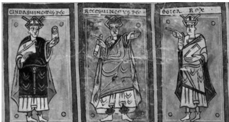
Il·luminació del Códice Vigilano (Escorial, Cod. D.I.2.), fol. 428.

Les genealogies navarresa i castellana serveixen per als objectius polítics de García de Eugui i s'han de posar en relació amb el context de redacció del text. En un moment en què l'aliança amb Castella és fonamental per als monarques navarresos, la seva història comuna –marcada per molts vincles familiars– és un pilar que serveix per demostrar la força de la unió entre tots dos. El text s'articula a partir de la successió dels reis i García de Eugui, com a servidor dels Èvrex, escriu una crònica destinada a presentar la història de Navarra en relació amb la història d'Espanya. De fet, el text principal consta de la història general de la península Ibèrica amb una secció al final dedicada a la d'aquest regne pirinenc.